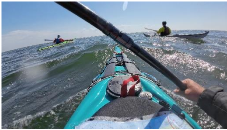
Immer wieder üben

Am Montag ging es bei schönstem Sonnenschein und auflaufendem Wasser wieder zurück nach Neuhasi. An der Bude im Hafen gab's noch ein Fischbrötchen zu essen, um gestärkt die Rückreise ins Ruhrgebiet anzutreten.