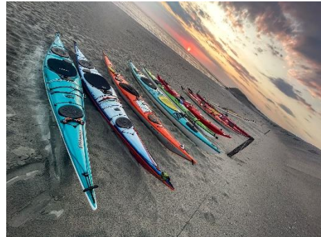
Kanu-Klub Zugvogel Seekajaktour 2024

Am Freitagmorgen ging es schon um 5 Uhr los, denn: „Alles wartet, nur die Tide nicht“.