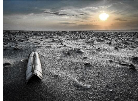
Schön war es

Am Montag ging es bei schönstem Sonnenschein und auflaufendem Wasser wieder zurück nach Neuhasi. An der Bude im Hafen gab's noch ein Fischbrötchen zu essen, um gestärkt die Rückreise ins Ruhrgebiet anzutreten.