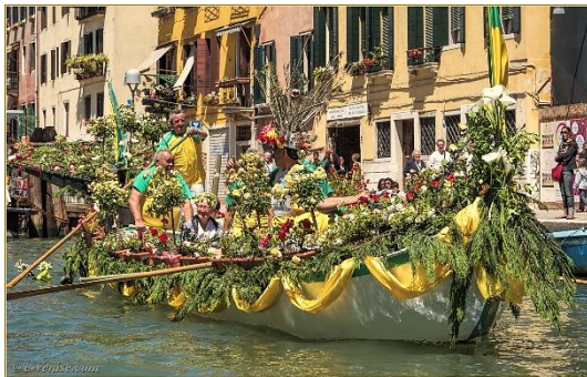
Buntes Treiben; Vogalonga 2024

Wenn am Morgen die Kanone am Markusplatz donnert, um den Start zu eröffnen, dann setzt sich ein buntes Treiben in Gang.