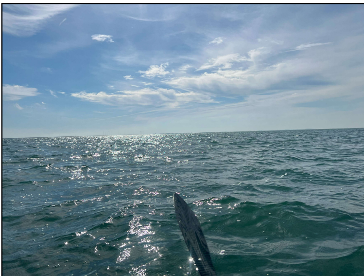
Auf einer Muschelbank machen wir Pause und genießen das Wetter.